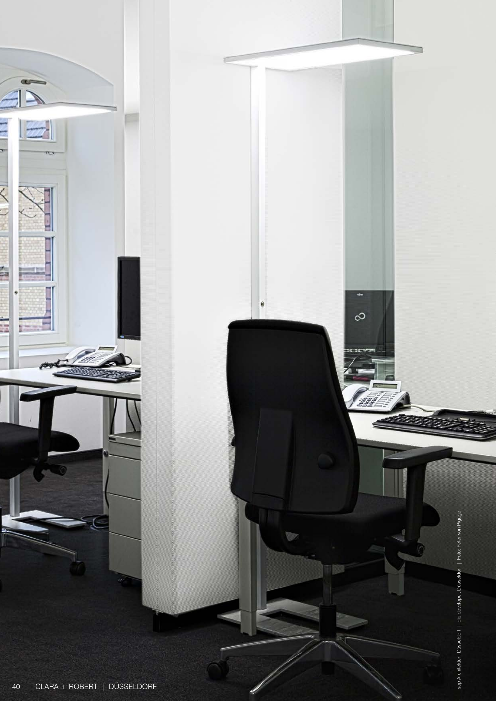
sop Architekten, Düsseldorf | die developer, Düsseldorf | Foto: Peter von Plogge